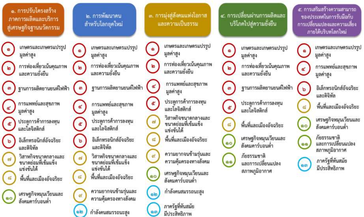
แผนภาพที่ ๓.๑ ความเชื่อมโยงระหว่างหมวดหมู่การพัฒนากับเป้าหมายหลัก

ความเชื่อมโยงระหว่างหมวดหมู่การพัฒนากับเป้าหมายหลักแสดงไว้ในแผนภาพที่ ๓.๑ โดยหมวดหมู่การพัฒนาที่กำหนดขึ้นเป็นประเด็นที่มีลักษณะเชิงบูรณาการที่ครอบคลุมการพัฒนาตั้งแต่ในระดับต้นน้ำจนถึงปลายน้ำ และสามารถนำไปสู่ผลพัฒนาทั้งในมิติเศรษฐกิจ สังคม ทรัพยากรธรรมชาติและสิ่งแวดล้อมไปพร้อมๆ กัน ทำให้หมวดหมู่แต่ละประการสามารถสนับสนุนเป้าหมายหลักได้มากกว่าหนึ่งข้อ นอกจากนี้การพัฒนาภายใต้แต่ละหมวดหมู่ไม่ได้แยกขาดจากกัน แต่มีการสนับสนุนหรือเอื้อประโยชน์ซึ่งกันและกัน